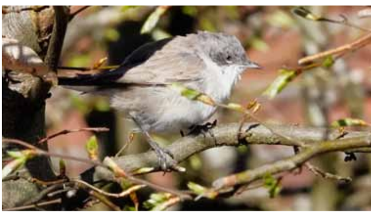
Siberische Braamsluiper.

Aan de Graaf Willemstraat in Bovenkarspel ontdekte een vogelspotter in een tuin een klein vogeltje. Men dacht aan een alge-