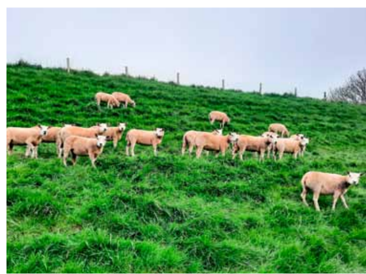
Pas geschoren weer op de dijk.