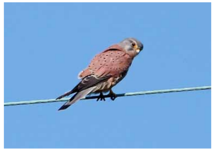
Torenvalkman zoekt voedsel.

Van 6 t/m 14 mei wordt overal in Nederland de Nationale Vogelweek gehouden. IVN West-Friesland heeft hart voor vogels en helpt ze op allerlei gebied, van weidevogelbescherming op de grond, oeverwaluwand in het open veld en Uilen- en andere vogelkasten ophangen in de boom. Daarna volgt de inventarisatie van al dat broedsel en het onderhouden van die vogelverblijven. Er is veel aandacht, kennis en passie voor vogels onder de IVN-gidsen.