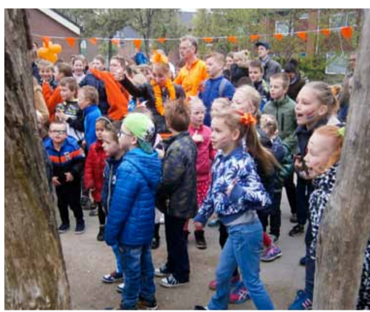
..... en daarna gingen de groepen sportief aan de gang.

Vervolgens gingen de groepen sportief aan de gang. De groepen 1-2 en groep 3-4 deden dit op het schoolplein met sportieve spelletjes. Groep 5 t/m 8 deden activiteiten bij De Krimper en sloten de dag af met een frisse duik in De Zeehoek. Wij kijken terug op een geslaagde dag.