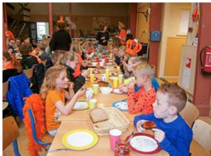
Gezamenlijk aan het Koningsontbijt.. Foto's aangeleverd

Op 21 april vierden we de Koningsspelen. We begonnen met alle leerlingen en veel ouders op het schoolplein met de 'Okido': Lekker dansen en zingen met elkaar. Daarna kregen de leerlingen in de hal van school het Koningsontbijt, nadat we het Wilhelmus hadden gezongen.