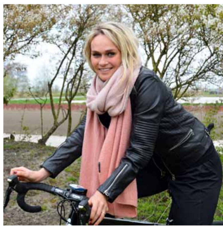
Irene Schouten thuis in Andijk.

Tijdens de trainingen wilden wij niet voor elkaar onder doen, we gingen altijd harder en harder. We maakten elkaar soms wel een beetje gek in de trainingen maar altijd met een lach. Pff wat gingen we soms kapot. Dan konden we de training maar net aan afmaken, we konden dan niet meer. We lachten er om... Maar als het