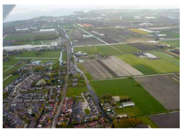
Op verzoek werd Andijk en Wervershoof aangedaan.