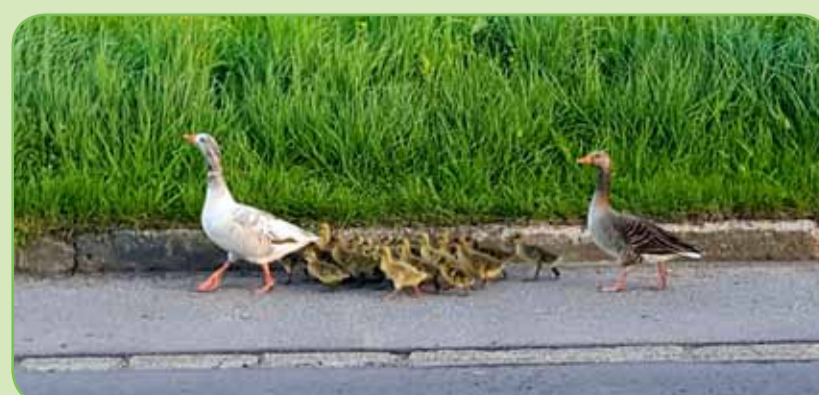
Hans van Dijke fotografeerde deze familie ganzen langs de Dijkweg