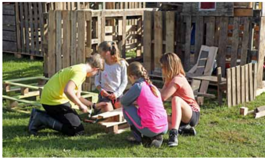
Vanaf morgen wordt er weer gebouwd. Foto's aangeleverd

Dit jaar al weer het 9 de Huttendorp Andijk (30, 31 augustus en 1 september) en wederom een record aantal inschrijvingen. 300 kinderen gaan bouwen, spelen, knutselen, kortom plezier maken. De vele vrijwilligers en sponsors maken het weer mogelijk om van Huttendorp Andijk een succes te maken.