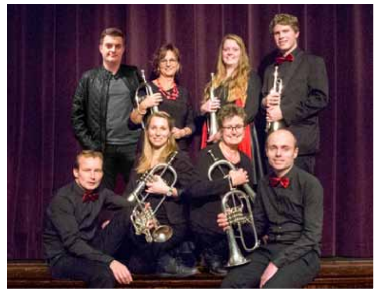
Het hoogkoper, trompet, cornet en bugel.

Morgen, donderdag 30 augustus, starten de repetities weer na een mooie zomer en is het orkest druk bezig met de voorbereidingen voor het jubileumconcert.