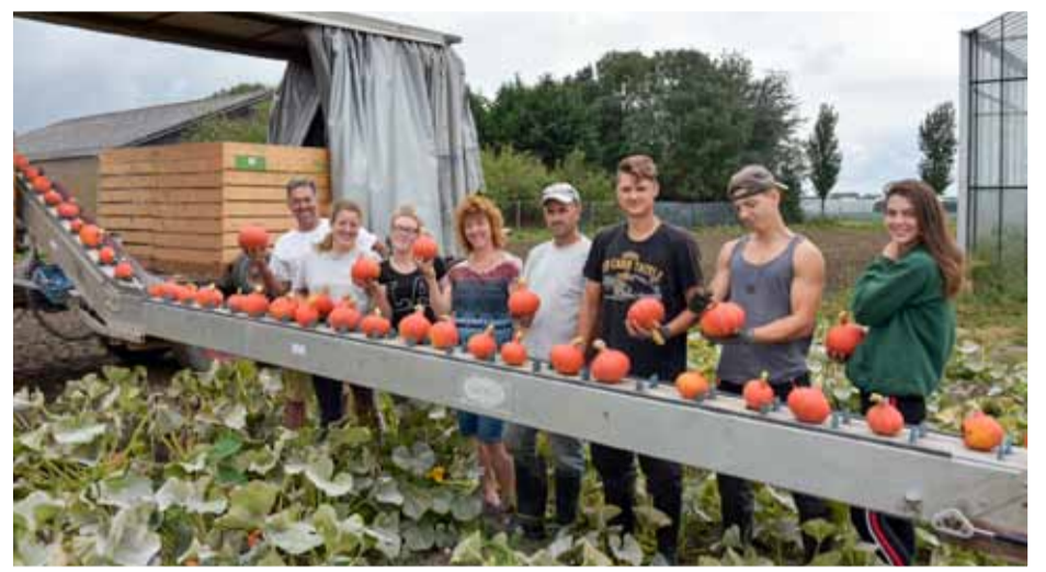
De pompoenen worden met droog weer geoogst.

Op het biologische bedrijf van T & H Vlaar bv teelt men, voor het zevende jaar, ongeveer 2,5 hectare.