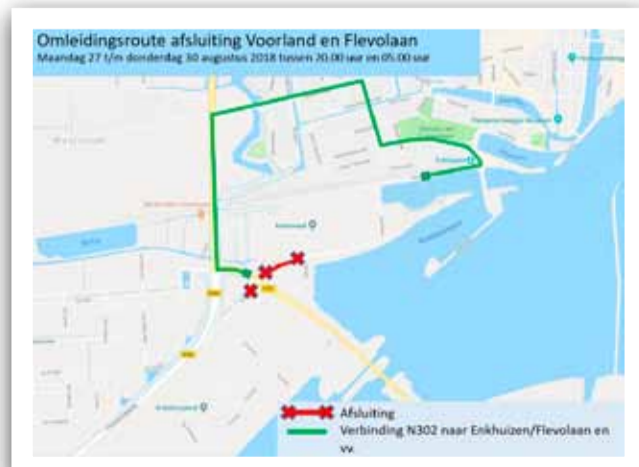
Omleidingsroute Voorland en Flevolaan.

Meer informatie: www.n23westfriisaweg.nl .