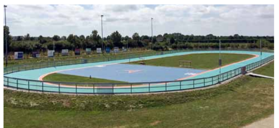
De Sjoerd Huisman Piste in Wervershoof.

Op woensdag 5 september om 17:00 zal de vernieuwde Sjoerd Huisman Piste aan de Theo Koomenlaan te Wervershoof worden geopend door de gedeputeerde van de provincie Noord-Holland, de heer Jaap Bond. Onze kampioenen van de WK/EK zullen worden gehuldigd en aansluitend zullen door de leden van Radboud inline-skating een demonstratie wedstrijd worden gereden.