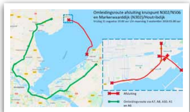
Omleidingsroute kruispunt N302/N506 en Houtribdijk

Met vragen kunnen weggebruikers en omwonenden contact opnemen met het provinciale Servicepunt, via tele-