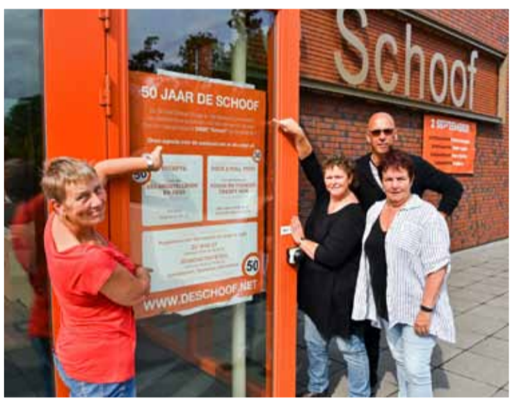
Een gouden openingsweekend in de Schoof

's Avonds is er een besloten feest voor (oud) vrijwilligers, medewerkers en bestuursleden.