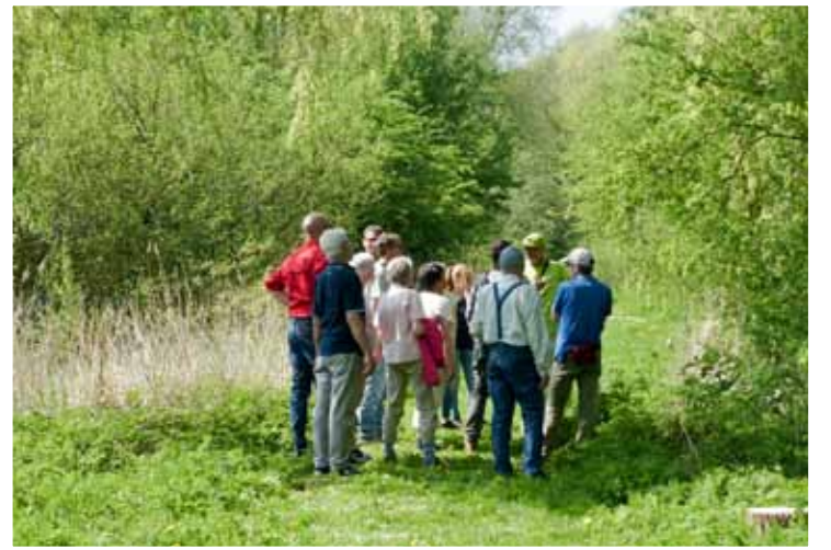
Op pad met IVN-gids.

Natuurlijke liefhebbers kunnen zondag 14 oktober o.l.v. IVN-gidsen een rondwandeling maken door het terrein van het Staatsbosbeheer ten noorden van Grootebroek.