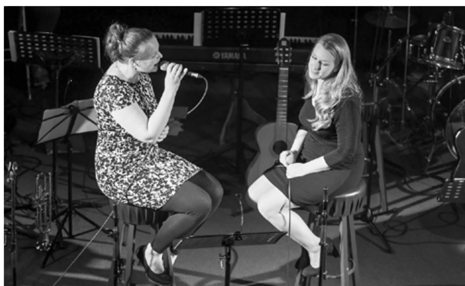
Back in Time!

Zaterdag 20 oktober wordt van 20.00 – 22.30 uur het derde Listen to the Music! concert gegeven in de Gereformeerde kerk, middenweg 4. Het thema is: Back in Time!