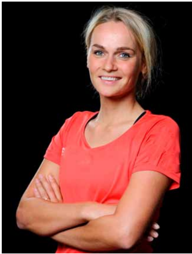
Irene Schouten schrijft wekelijks een Blog.

Irene Schouten leeft voor de schaatssport. Maar dat leven reikt verder dan het schaatsen op zich. De steun van het thuisfront, haar vrienden, collega's, coaches en sponsors zijn essentieel voor haar succes. Zowel zakelijk en privé.