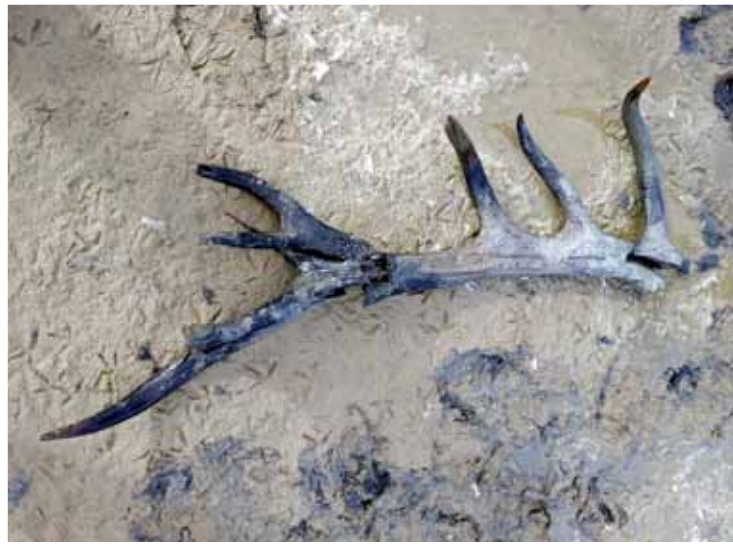
Het gewei van een Edelhert.

Maandagmiddag 1 oktober waren wij aan het werk bij het vogeleiland in de waterberging van Twisk. Omdat het water extra laag stond zagen we dat twee punten van een hoorn uit de modder omhoog staken. Boswachter Roelf Hovinga van Landschap Noord-Holland dacht aan een hoorn van een koe maar het pakte anders uit. Met de schop werd een gewei van een edelhert blootgelegd, een unieke vondst uit de middeleeuwen of simpel daar neergegoid