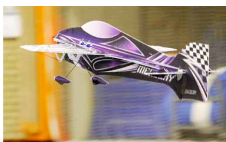
Modellen gemaakt van Depron. Foto aangeleverd