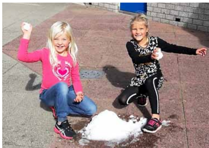
Nu al ijspret in De Weid!

Uuh; sneeuwballen, nu al? Nee hoor, de vrijwilligers van De Weid zijn na het succesvolle laatste weekeinde in september op hun gemak bezig om De Weid winterklaar te maken. Onderdeel daarvan is het schoonmaken van de vriezers met ijspret tot gevolg!