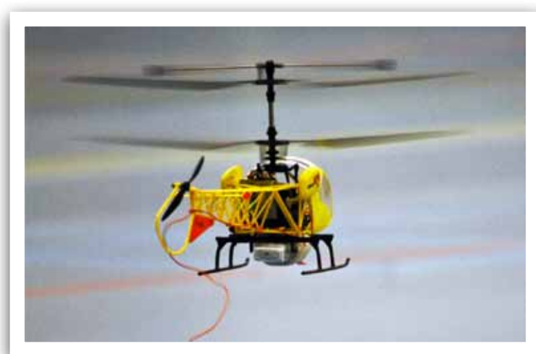
Helikopters zijn er ook.

Er zullen ook drones te zien zijn, een groep enthousiastelingen binnen onze club die gefascineerd zijn door de technologie rondom drones, zullen hier hun behendigheid op de proef stellen. Het is de bedoeling dat u gaat