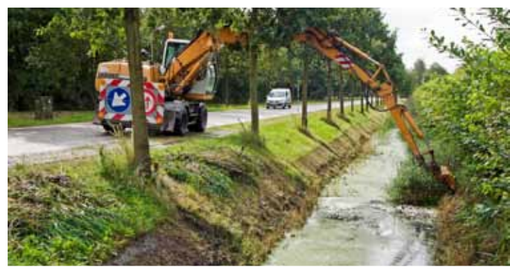
De najaarsschouw begint. Foto aangeleverd

Vanaf maandag 15 oktober controleren zo'n honderd schouwmeesters de sloten in het gebied van Hoogheemraadschap Hollands Noorderkwartier. Zij kijken of de sloten voldoende schoon zijn. Een schone sloot is nodig om het water snel af te kunnen voeren naar gemalen tijdens het storm- en regenseizoen. De sloten moeten vrij zijn van (water)planten en afval die de doorstroming van het water kunnen belemmeren. De najaarsschouw is elk jaar vanaf de 3 de maandag in oktober.