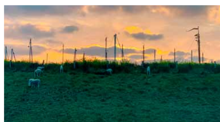
Nabij de Kreupel.