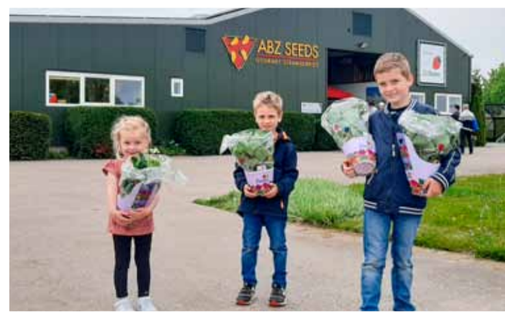
Het was ouderwets druk en gezellig bij ABZ.

Afgelopen zaterdag vond weer een 'ouderwets' drukke en gezellige aardbeiplanten-verkoop plaats bij ABZ Seeds. De plantenkopers, jong en oud, kunnen deze zomer genieten van verse aardbeitjes uit eigen tuin.