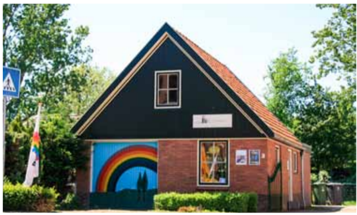
Rommelmarkt bij Boekshop Josia.

Op 28 mei (de zaterdag na hemelvaartsdag) is er een rommelmarkt bij Boekshop Josia. Boekshop Josia ligt aan de doorgaande weg in Andijk, Middenweg 77, tussen de 2 supermarkten (Deka en Lidl) in.