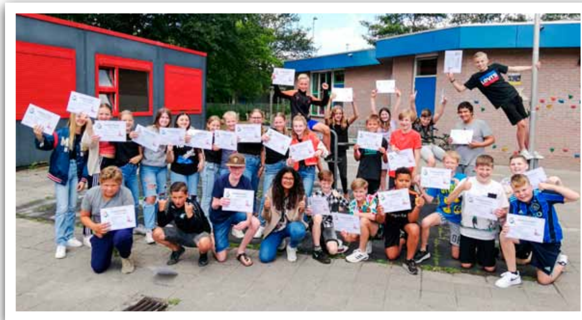
De Koninklijke EHBO vereniging afdeling Andijk wil alle kinderen van groep 8 van basisschool De Kuyperschool feliciteren. Want zoals u kunt zien zijn alle kanjers geslaagd voor het Jeugd EHBO! Foto aangeleverd