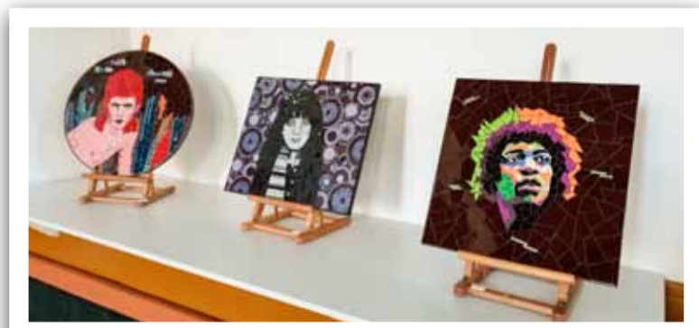
Welkom op de expositie.

Mijn naam is Ellen Mulder en ik ben geboren in 1960 te Amsterdam. Mijn passie is mozaïek. Ik begon met tegels knippen en snijden maar dat gaat na een aantal jaren wat saai worden. Nu werk ik met allerlei soorten materiaal met glas, tegels, servies,