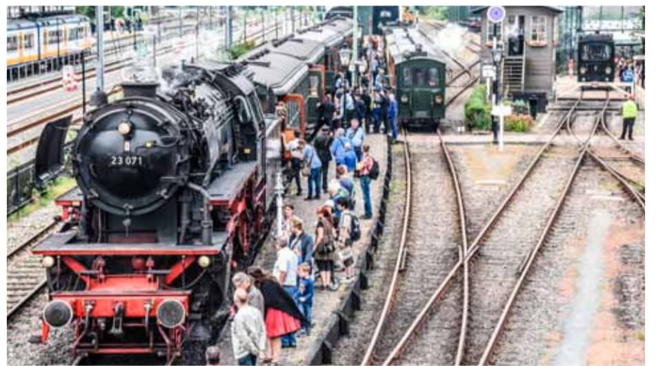
Holland boven Amsterdam Express.

De Museumstoomtram Hoorn-Medemblik heeft zijn dienstregeling en extra activiteiten voor de komende zomer bekend gemaakt. Vanaf 16 juli tot en met 28 augustus rijden meerdere stoomtrams per dag. Er kan weer worden meegereisd met de Zomer Avond Express en er worden speciale themadagen met historische reizigers en het vervoer van goederen georganiseerd. Bovendien introduceert het rijdende museum de Holland Boven Amsterdam Express.