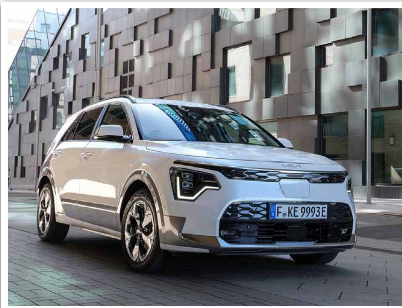
Niro EV biedt een reeks innovatieve en intuïtieve fun.

Kia ( www.kia.com ) is een aanbieder van mobiliteit en wil klanten wereldwijd door beweging inspireren. Kia, opgericht in 1944, levert al meer dan 75 jaar mobiliteitsoplos-