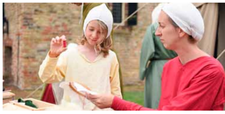
Beleef de Middeleeuwen!

Beleef de middeleeuwen! Bij Kasteel Radboud staat het weekend van 20 en 21 augustus in het teken van het Graventapijt.