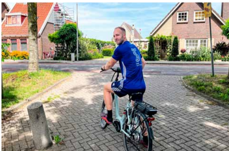
Aanmelden bij Ramon.

Houd u van fietsen of wilt u meer in beweging komen deze zomer? Dat kan! Binnen het programma Doortrappen worden in augustus en september in West-Friesland rustige fietsroutes georganiseerd door Team Sportservice. Bent u er ook bij?