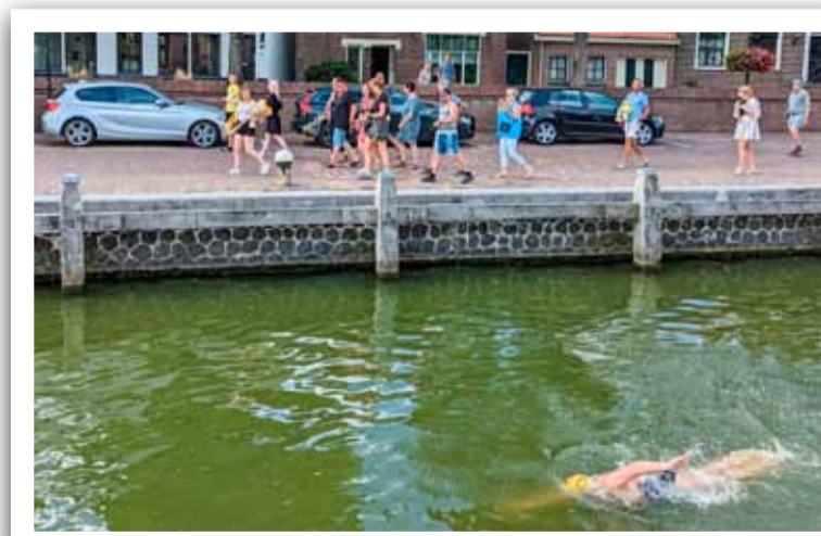
De aankomst in Medemblik