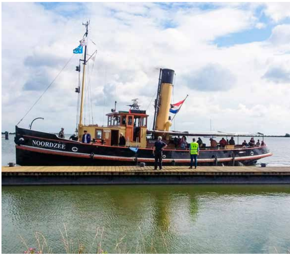
De Noordzee aan de steiger. Foto aangeleverd

Op zaterdag 13 en zondag 14 augustus meert bij het Nederlands Stoommachinemuseum, gevestigd in het voormalig stoomgemaal Vier Noorder Koggen, een aantal authentieke stoomsloepen af aan de museumsteiger. Het is een prachtig schouwspel de sloepen met grote rookpluimen af en aan te zien varen op de Kleine Vliet. Voor alle sloepen geldt: ze hebben een ketel en stoommachine aan boord voor de voortstuwing. Bij voldoende capaciteit mogen bezoekers een stukje meevaren met de sloeipeigenaren.