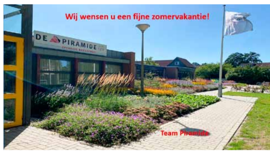
Geniet van de prachtige voortuin!

Met de musical 'Wie steelt de show' hebben de leerlingen van groep 8 afscheid genomen van hun basisschooltijd op basisschool de Piramide! Bij een afscheid sta je ook altijd even stil op wat je achterlaat.