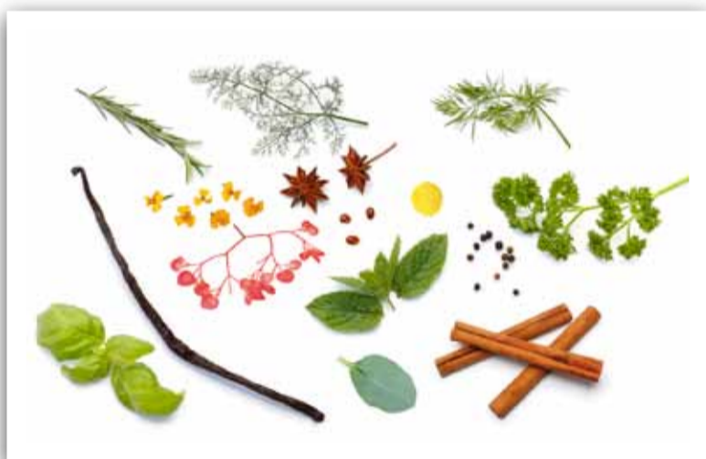
Cressen proeven in Sow to Grow.

Op zaterdag 23 juli zal er opnieuw gelegenheid zijn om in quizvorm smakelijke kiemplanten, ook wel cressen genoemd, te proeven. U bent van 12.00 tot 17.00 uur welkom bij het museum aan de Westerstraat 111 in Enkhuizen.