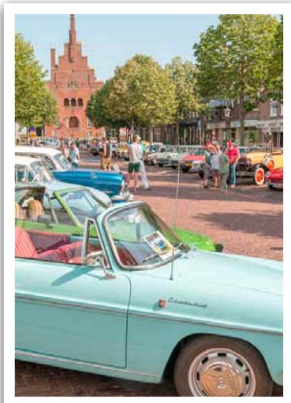
Oldtimers op de Nieuwstraat.

Aankomend weekend wordt het als vanouds genieten tijdens de Oldtimerdag in het historische centrum van Medemblik. Zondag 24 juli komen de klassiekers vanuit heel Nederland onze kant weer