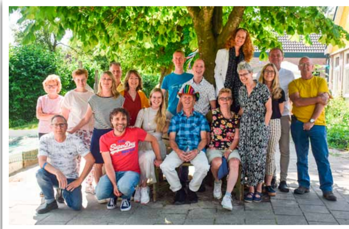
Familieman Sjaak (midden voor) gaat met pensioen.

Meester Sjaak heeft een technische achtergrond en dat is te merken. Naast zijn werk als meester tovert hij in zijn vrije tijd een ‘oude snoek’ om tot een