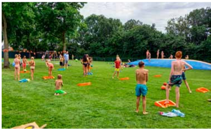
Het stoepranden was een succes. Foto's aangeleverd

Op 15 juli 2022 was De Weid het toneel van de Andijker voorronde voor het NK Stoepranden. Waar de bezoekersaantallen normaal al groot zijn voor een