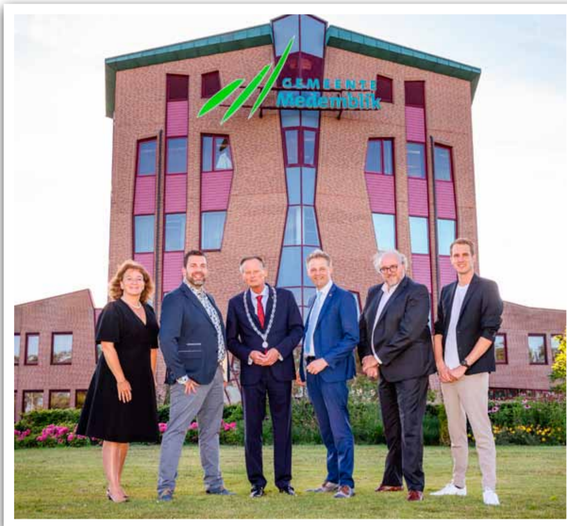
Het nieuwe college.