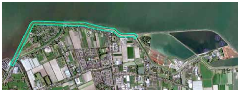
De vliegroute over de dijk langs de Proefpolder.

Nieuwe technieken verbeteren inzicht in toestand van de dijk