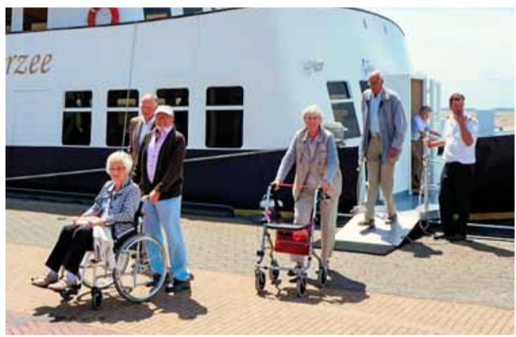
Een uitstapje met de Zonnebloem naar Urk. Foto's aangeleverd

"We vieren 50 jaar de Zonnebloem in Andijk. Dit is eigenlijk al 52 jaar, maar in 2021 was het volop Corona en niet de tijd om een jubileum te vieren." Een vereniging waar zoveel energie in zit, met zoveel vrijwilligers die veel gasten van Andijk ondersteunen in vaak moeilijke tijden van ziekte, ouderdom en eenzaamheid, verdient het om in het 'zonnetje' gezet te worden.