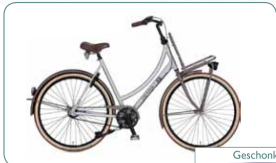
Cortina Common U4 alu brushed damesfiets