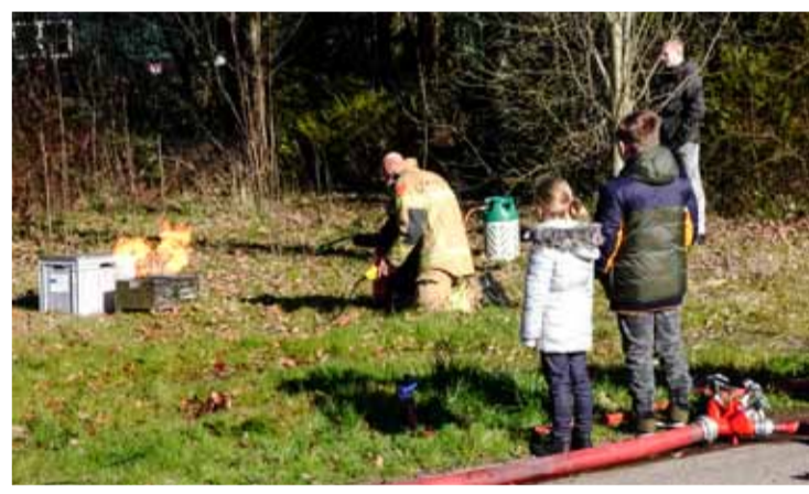
De brand werd geblust.

Vrijdag morgen waren er bij de brandweerkazerne aan de Hoekweg vlammen te zien. Een groepje kinderen stond toe te kijken bij een brandje terwijl een van de kinderen, ondertoeziend oog van een ervaren brandweerman, de straalpijp op het vuur richtte om het vuur te bestrijden.