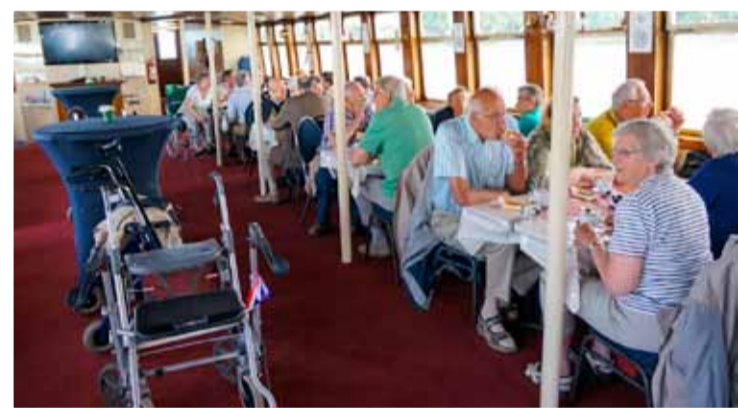
Gezellig met elkaar aan de lunch.