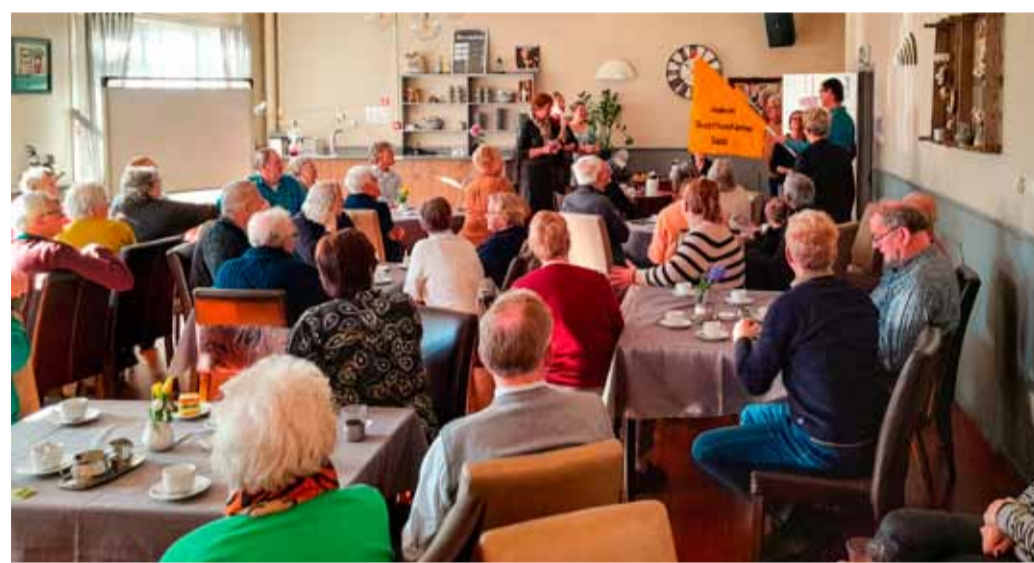
Grote belangstelling bij de officiële opening.

De initiatiefnemers vonden het een zeer geslaagde bijeenkomst en hopen dat de inwoners uit de wijk ook in de toekomst de Buurthuiskamer weten te vinden. Daarnaast zijn er onder bezoekers en de initiatiefnemers nog veel ideeën om andere laagdrempelige activiteiten te ontwikkelen en te organiseren die veel andere inwoners ongeacht leeftijd zullen aanspreken. Het motto van de vrijwilligers is dan ook: wij doen dit met en voor elkaar en iedereen is hier welkom!