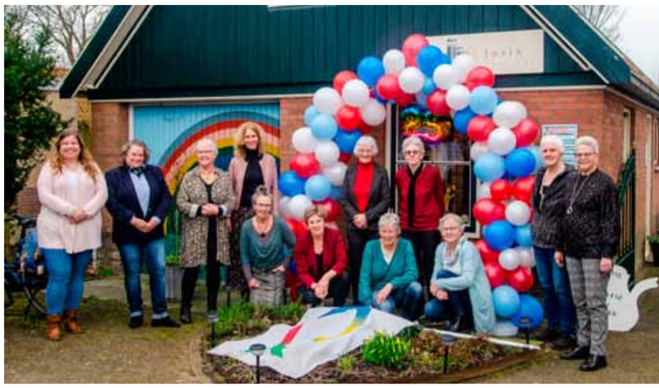
Het vrijwilligersteam van boekshop Josia.

Zaterdag 4 maart vond bij Boekshop Josia de aftrap plaats van alle activiteiten die in de maand maart georganiseerd zullen worden. En deze aftrap was zeker geslaagd en kan zeker spetterend genoemd worden!