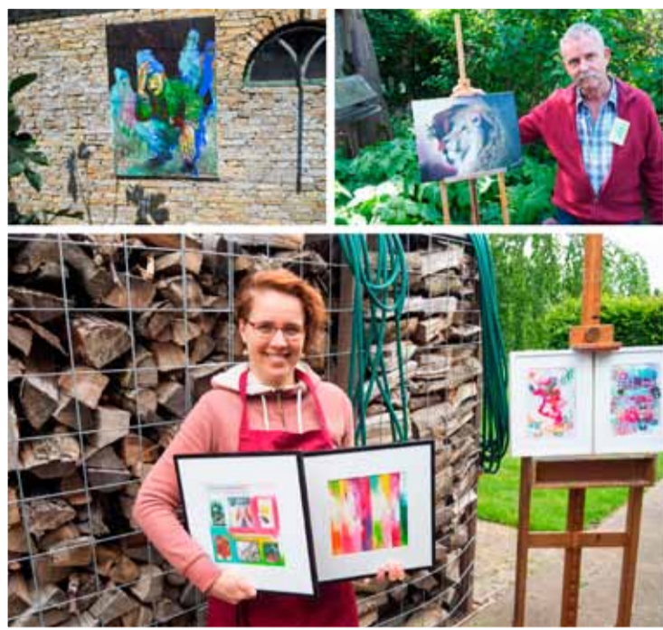
Een eerdere editie.

Ook dit jaar gaat de Kunst- en Tuinroute weer van start! Op zaterdag 3 juni 2023 (11:00 uur – 16:00 uur) zal de volgende editie plaatsvinden. Die zaterdag zullen vele Andijkers hun tuinen of huis weer openstellen met prachtige kunstwerken, handwerken of andere creatieve hobby's!