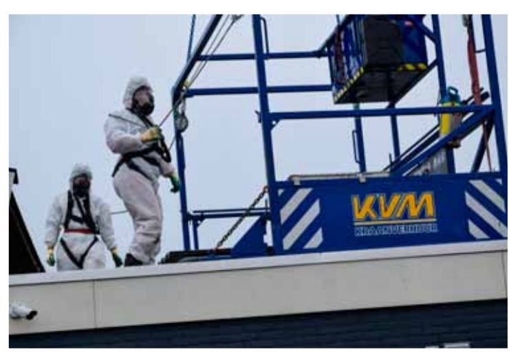
De werklui van Middendorp Montage.

Deze week werd er gestart met de renovatie van de oude Koekfabriek Andijk. De schuine da-