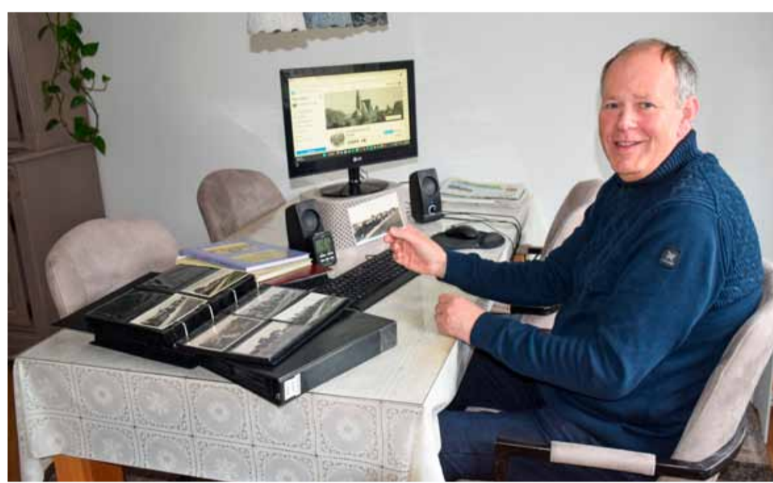
Oude ansichtkaarten van Andijk geven een mooie kijk op de geschiedenis van ons dorp. Tekst en foto OdB

De oude ansichtkaarten, soms met en soms zonder handgeschreven teksten achterop, worden zorgvuldig uitgezocht en keurig in mappen opgeborgen. "Mappen vol, per straat of gebied,