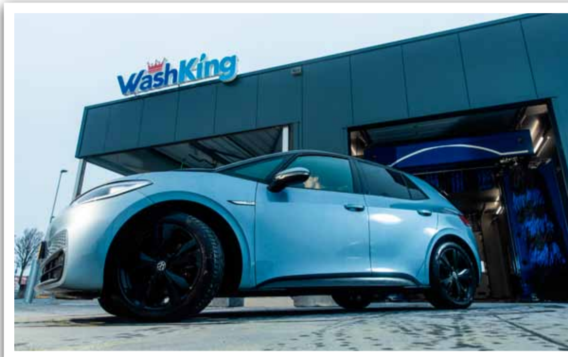
Openingsfeest bij Wash-King Andijk.