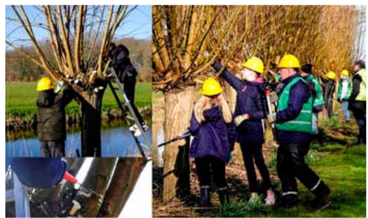
De kinderen waren niet te stoppen.

Het IVN heeft woensdag morgen 38 kinderen van een basisschool groep 8 bij het Egboetje ontvangen. Daar werd de groep in tweeën gesplitst en ging een groep naar binnen voor les over de natuur. De andere groep kreeg eerst les in het veilig omgaan met de takkenschaar en zaag om willen te knotten. Lekker in het zonnetje gingen ze de bomen te lijf