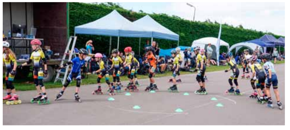
Kom zondag 26 maart proberen!

Beginners - Recreanten - G-sporters - Wedstrijdsporters - 'Schaats' Training