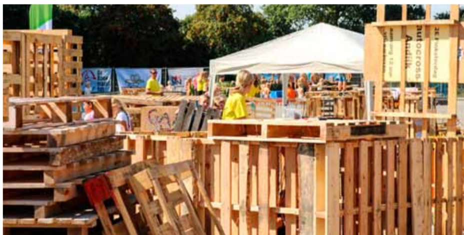
Een eerdere editie van Huttendorp.

Huttendorp Andijk is terug en het is beter dan ooit! Na een succesvolle editie in 2022 zijn we klaar om de kinderen van Andijk opnieuw een onvergetelijke ervaring te bezorgen. Dit jaar vindt het evenement plaats op 31 augustus, 1 en 2 september. Het aanmelden voor Huttendorp Andijk 2023 gaat opnieuw online. Als je in groep 3 t/m 8 zit en in Andijk woont of in Andijk naar school gaat, kun je je aanmelden via het online formulier op onze website. De inschrijfkosten bedragen €25,00 en kan fysiek worden betaald op 18 april van 19.30 tot 20.30 uur in dorps huis Cultura en op 20 april van 19.30 tot 20.30 uur in dorps huis Centrum.