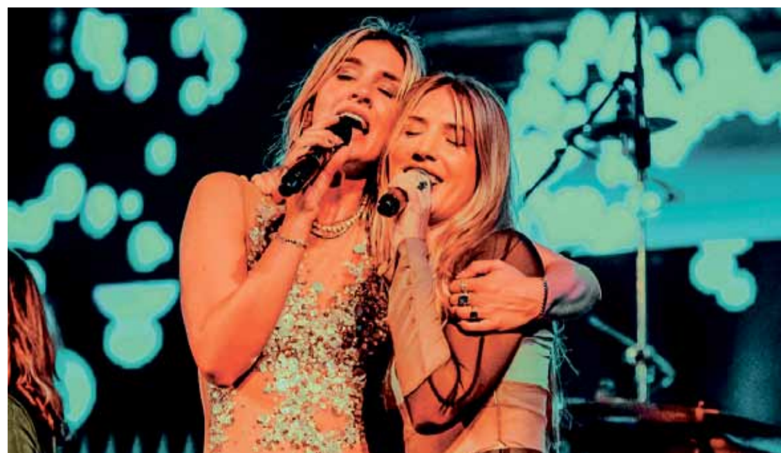
Laten wij er een onvergetelijk weekend van te maken!