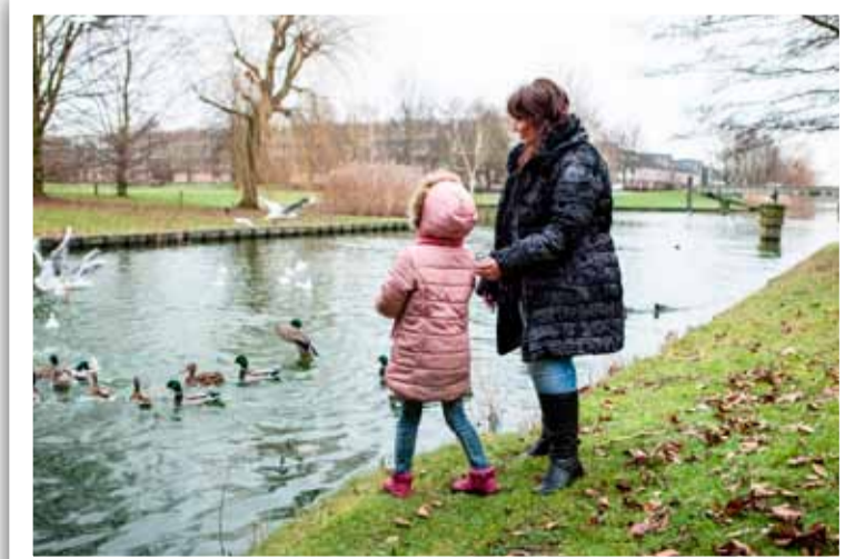
Wordt vrijwilliger bij Home-Start.

Miranda over haar vrijwilligerswerk: „Ik ben zelf moeder van drie kinderen en weet dat het