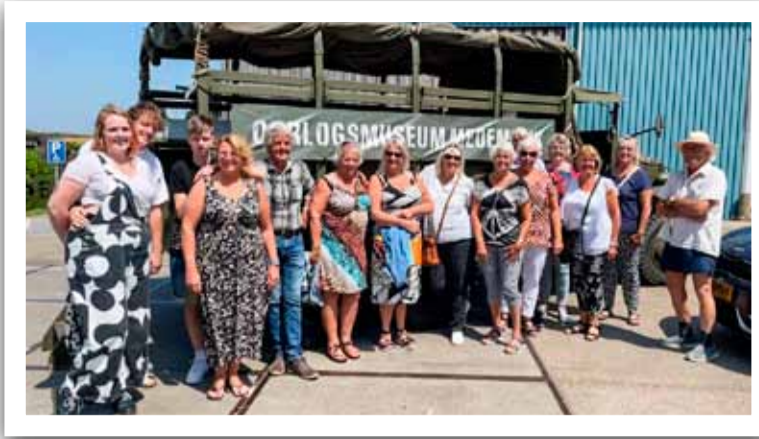
De groep voor de legertruck.

Met deze gezellige groep stapten we op zaterdag 17 juni in een echte Amerikaanse legertruck voor een rondrit door Medemblik. Wij hielden stil bij het Gar-