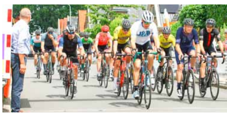
Wielerronde in Venhuizen.

Al sinds de jaren '70 van de vorige eeuw rijden wielrenners door de straten van Venhuizen. Wie kent de Drieban Tour niet? Jaarlijks reden na de Tour de France de profwielrenners letterlijk de klinkers uit de straat. In 2017 is het bestuur een nieuwe weg ingeslagen. Onze nadruk is komen te liggen op de regionale wielrenners en de jeugd.