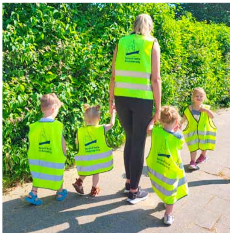
De medewerkers gingen met de peuters op pad. Foto aangeleverd

Vorige week tijdens de Week van de Gezonde Jeugd heeft Kinderopvang Berend Botje meegedaan met de Peuter4daagse. Op verschillende locaties gingen de pedagogisch medewerkers met de peuters én baby's op pad. Dagelijks tijdens de opvanguren van de kinderen liepen zij minimaal een kwartier langs een zelf uitgezette route. De kinderen kregen een stempelkaart en na afloop van vier dagen wandelen ontvin-