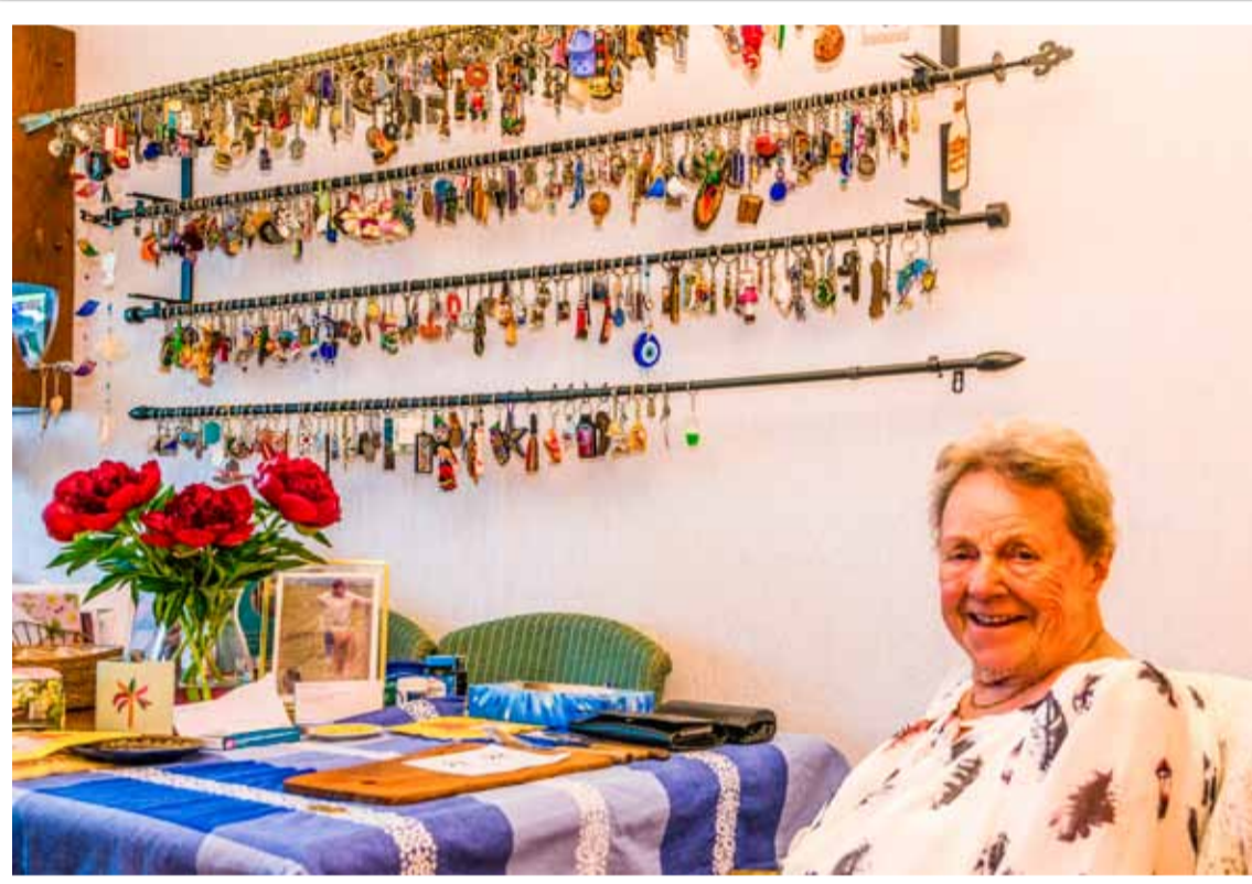
Mevrouw van Oeffelen voor haar verzameling sleutelhangers. Tekst en foto Corina Sas

Alle 442 verschillende sleutelhangers, mooi of niet mooi, hangen aan verschillende gordijnroedes, zowel aan de eigen ringen, of vastgemaakt met zwarte tierrips. Voor een nog beter overzicht moet er eigenlijk nog een roede bij, vindt mevrouw. Zo kan iedereen, die op bezoek komt, de ver-