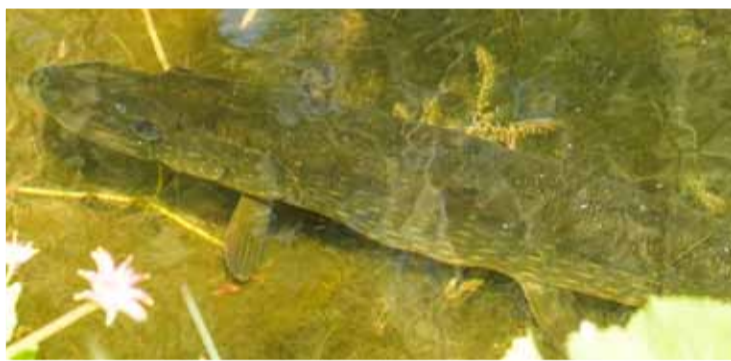
De snoek wacht op een prooi.

Iedereen liep dit weekend te puffen en te zweten. In de vijver lag rustig deze snoek op z'n gemakje lekker in het zonnetje te wachten en had er geen last van. Zodra een prooi voor de grote bek ver-