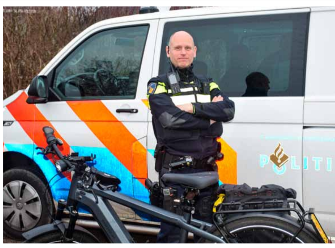
Hopelijk zoeken mensen mij op als ze me tegenkomen. Tekst en foto: Odb/De Andijker

Ook al is het werk heel divers, Frans heeft wel heel duidelijk wat er wél en niet bij de politie hoort. "Wij zijn er niet voor futiliteiten, niet voor bemiddeling. Wij zijn er wél om mensen te helpen en misdaad te stoppen. Wij zijn er als er strafrechtelijke feiten zijn gepleegd, waarbij de overheid dus dient op te treden." Strafrecht, verkeer- en milieuzaken (waaronder ook geluidsoverlast, maar geen leef geluiden) zijn politiezaken. Om het maar zo te zeggen: u belt de politie niet voor een gevonden portemonnee, u meldt wél een diefstal/gestolen portemonnee. "Soms is het ook voor ons een kwestie van keuzes maken, want ook wij zijn maar op één plek tegelijkertijd inzetbaar. Ook als u geen reactie krijgt op een melding, dan hebben we hem wél gelezen en genoteerd, maar