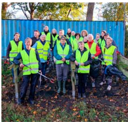
Samen steken we de handen uit de mouwen. Foto aangeleverd

Wij gaan weer zwerfvuil ruimen a.s. zaterdag. In dit nieuwe vroege voorjaar is het de beurt aan struikge- was en plantsoenen. Waarom?