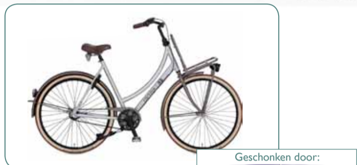
Cortina Common U4 alu brushed damesfiets