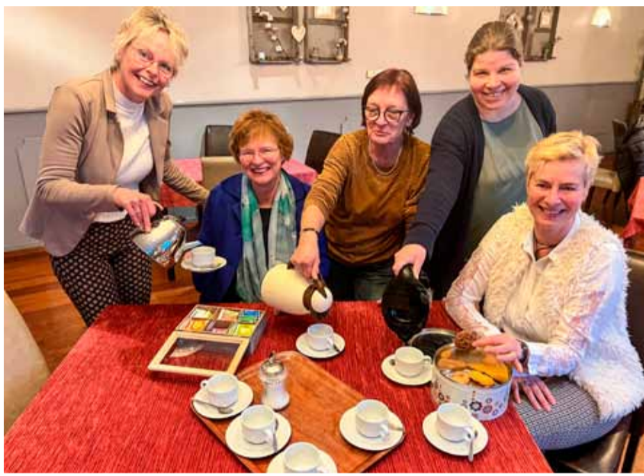
Aanstaande vrijdag is de officiële opening. Tekst OdB

In januari werd gestart met een mooi nieuw initiatief op Andijk-West in de kleine zaal van Sarto. Elke maandag- en vrijdagochtend tussen 10 en 12 uur zijn daar twee vrijwilligers aanwezig in wat ze noemen 'Buurthuiskamer Sarto', die u voorzien van koffie of thee met een koekje.