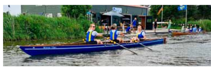
Maak kennis met roeien. Foto aangeleverd

Op 25 maart, van 12.00 tot 16.00 uur kunt u komen kennismaken met roeien! Roeien is in de buitenlucht je hoofd leegmaken terwijl je al spieren gebruikt.