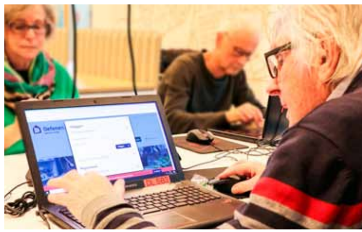
Klik & Tik in de bibliotheek.

De Klik & Tik cursus is voor iedereen die met de computer wil leren werken maar niet weet hoe te beginnen. In de Westfriese Bibliotheken begint in januari weer een nieuwe reeks gratis computercursussen. Dit is een cursus van 6 weken, waar je in een kleine groep en onder begeleiding leert met een computer om te gaan, leert internetten en e-mailen. Dit doe je stap voor stap, op je eigen tempo. Ook is het mogelijk om thuis of in de Bibliotheek zelfstandig verder te oefenen met het Klik & Tik programma. Je kunt voor €12,50 een lesboek aanschaffen dat je ook na de cursus als naslagwerk kunt gebruiken. Na deze cursus kun je zelfstandig met de computer werken, informatie vinden op het internet, e-