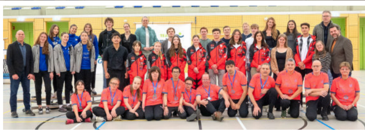
De sporthelden van de gemeente Medemblik.

Op zaterdag 11 januari was er extra aandacht voor de sporthelden van gemeente Medemblik. Alle lokale sporters die in 2024 één of meerdere ereplaatsen behaalden op een (inter)nationaal kampioenschap werden in de Westfriesdhal in Wognum gehuldigd door sportwethouder Gerben Gringhuis.