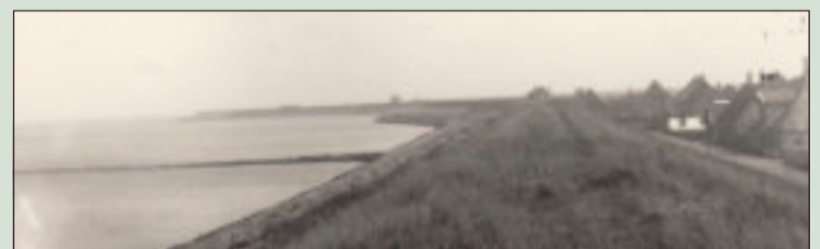
Geuzenbuurt Andijk ongeveer 1920

Bij het afscheid, toen er condoleantie was, lag op haar kist haar levensboek. Mooi dat ik haar heb leren kennen.