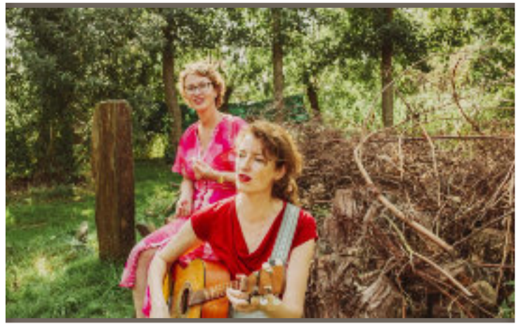
Soelaas in theatercafé van talent uit De Streek.

Bij Postkantoor Live! geniet je elke tweede zondag van de maand in ons sfeervolle theatercafé van talent uit De Streek. Van een singer-songwriter met eigen muziek tot een complete band die klassiekers in een nieuw jasje steekt: met Postkantoor Live! beleef je altijd een bijzonder concert in een informele setting.