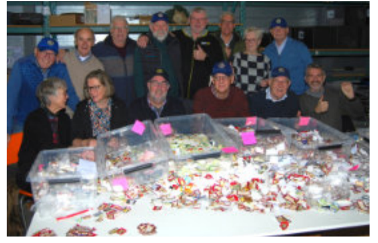
Duizenden pakken koffie voor de voedselbank.

Lionsclubs Opmeer-Medemblik en Enkhuizen bundelden afgelopen december hun krachten om samen met de Voedselbank West-Friesland het geweldige resultaat van de Douwe Egberts punten actie van 2023 te overtreffen. Toen haalde Lionsclub Opmeer-Medemblik bij hun eerste deelname meteen 2,5 miljoen punten op.