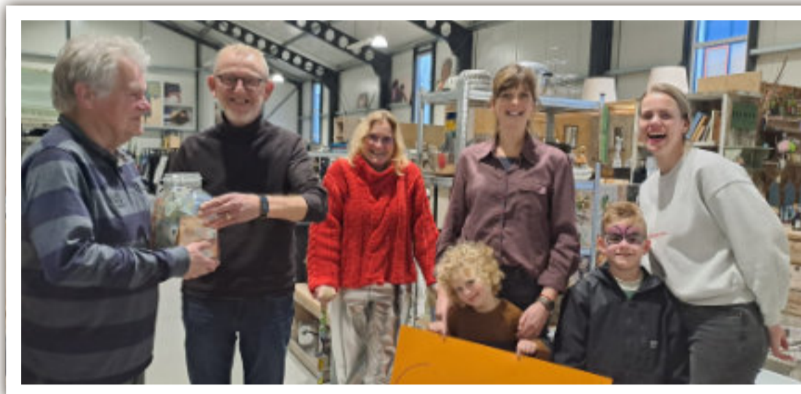
De pot met geld en de cheque werden overhandigd in de Dorcaswinkel. Foto aangeleverd.

We hebben contact gezocht met de organisatie en we werden 20