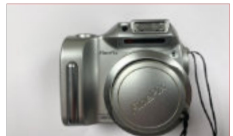
Kodak EasyShare Z 740 Kodak kant en klare foto in 1 minuut Fotorolletjes los en in doosjes Polaroid zie verpakking Hama UV 390 Project filter Tom Tom in doos