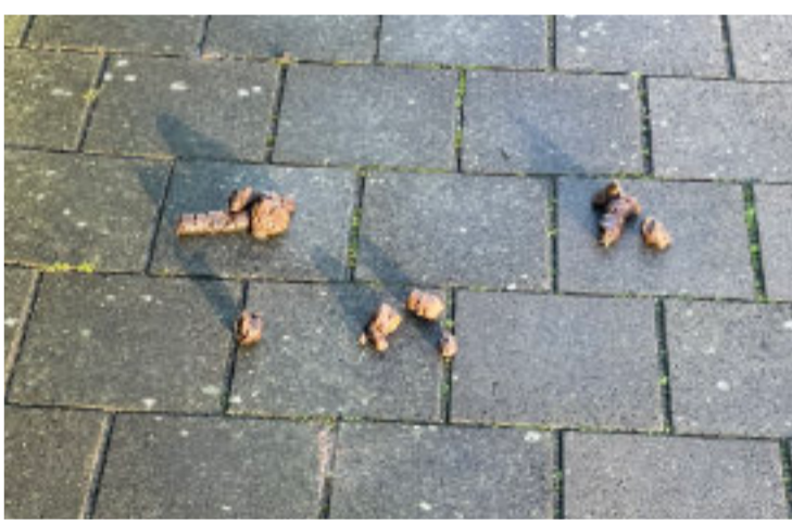
'Hondenuitlaatplaats' Meander.