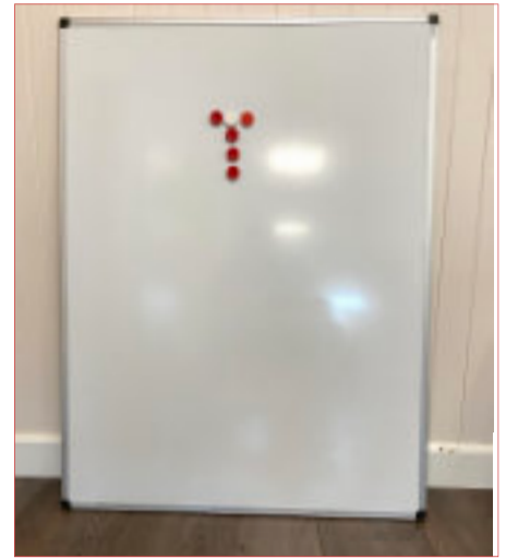
Magneetbord inclusief viltstiften en magneetjes. Formaat b x h 90 x 120 cm. 15,-