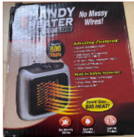
Handy heater Turbo 800, 10,-