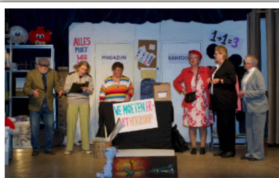
KNA heeft er een mooie puinhoop van gemaakt.

Vrijdag en zaterdag dé uitvoeringen van KNA van de het blijspel 'Puinhoop in de kringloop'. Een geolied rommeltje waarin uiteindelijk alles een goede afloop krijgt.