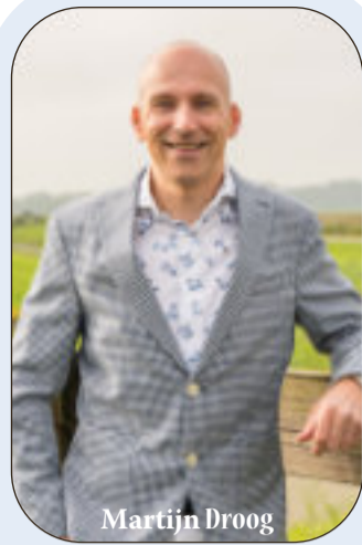
Er schuilt een Andijker in ieder van ons

U bent vanaf 17.30 van harte welkom, aanvang diner is om 18.00 uur. Rond 20.00 willen we de avond gaan sluiten.