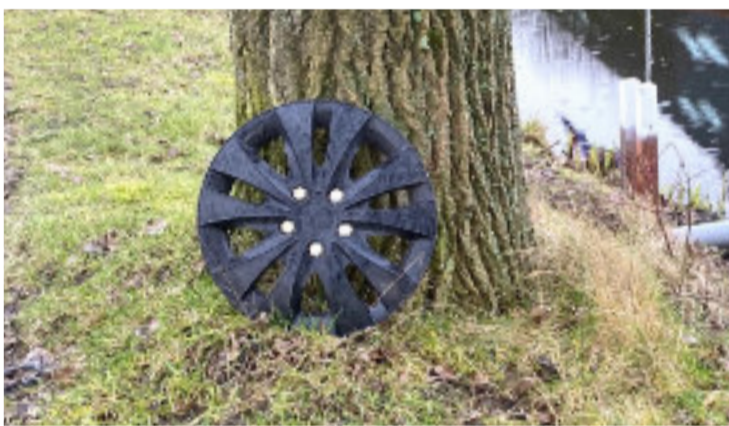
Langs de Beldersweg is deze wioldop keurig en goed zichtbaar tegen deze boom neergezet. Wie mist hem?