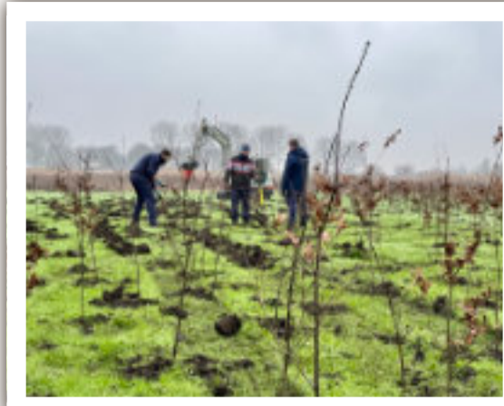
Aanplant in De Weelen.

Medemblikse wethouder groenbeheer, Harry Ne-