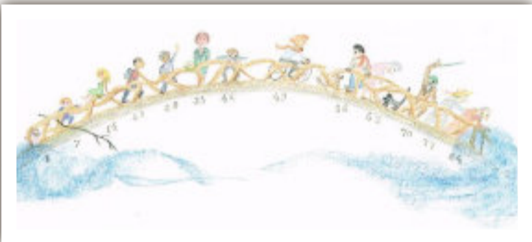
Tekening Rob de Waepenaere

De cyclus van het leven is een brug van betekenis. Een reis waarin elke stap telt, van het eerste begin tot het laatste afscheid.