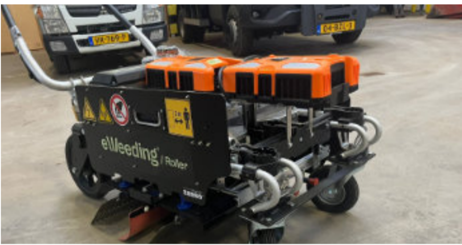
De eWeeder lijkt op een grasmaaier.

Deze week zijn er drie eWeeding-rollers afgeleverd door het Limburgse Wimmer-son BV en in ontvangst genomen door enthousiaste medewerkers van de buitendienst van gemeente Medemblik.