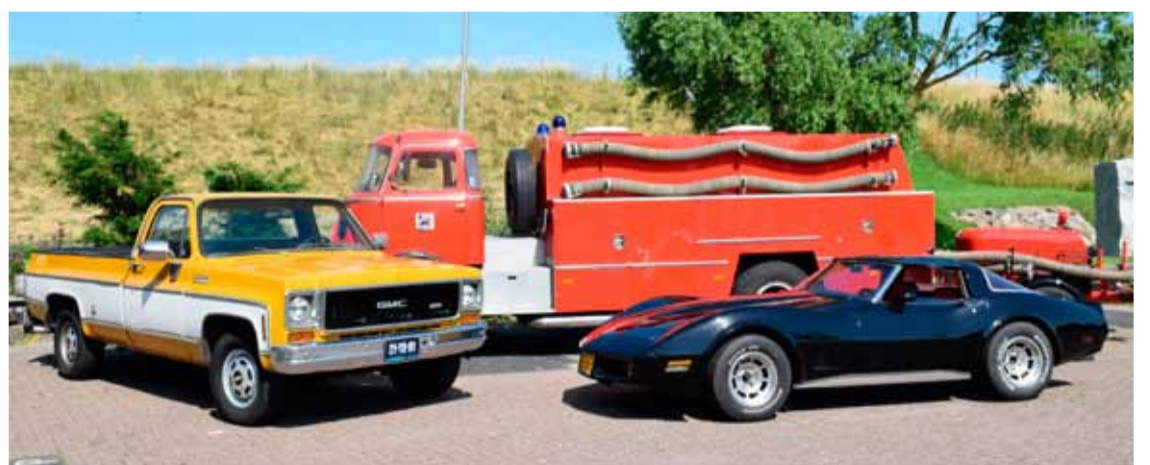
De GMC, Daf 2200 en de Corvette.