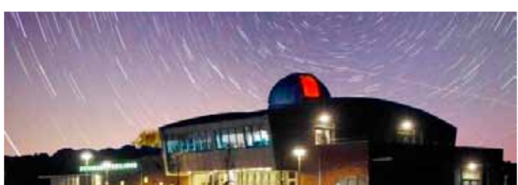
Volkssterrenwacht Orion. Foto aangeleverd