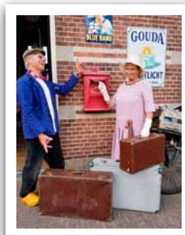
Plezier op een station van de Stoomtram Hoorn-Medemblik.

Alle inwoners van de gemeente Medemblik ontvangen met de Medemblicker van 5 september de Monumentenkrant met beschrijvingen, foto's en een plattegrond.