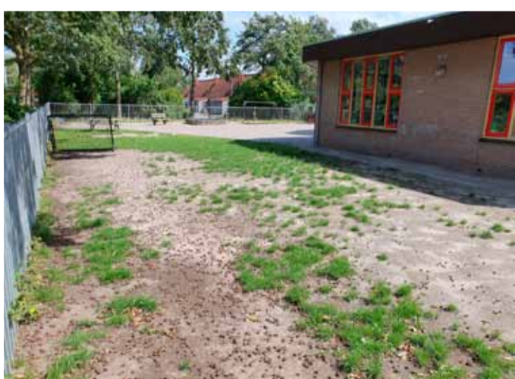
Oude situatie. Foto's aangeleverd