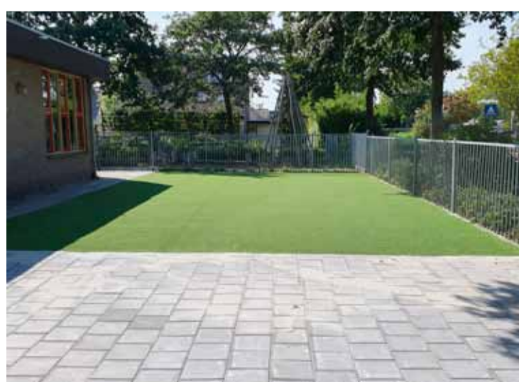
Situatie na oplevering

Afgelopen vakantie heeft het schoolplein van de Kuyperschool een metamorfose ondergaan. Het oude grasveldje, wat vaak een modderpoel werd na een regenbui, is voorzien van een kunstgrasmat.