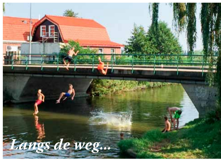
Langs de weg...

Zaal open om 13.30 uur, aanvang 14.00 uur. In de Schoof. Kerke-laantje 1 in Wervershoof.