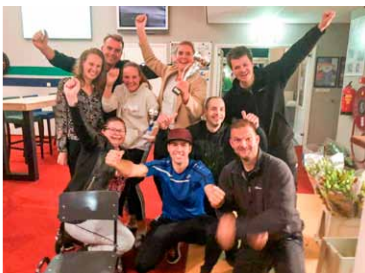
Het winnende team.