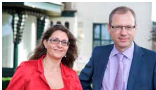
VANWEGE ONZE JUBILEUMVIERING MET HET PERSONEEL IS ONS KANTOOR OP VRIJDAG 4 EN ZATERDAG 5 OKTOBER GESLOTEN.

Voor iedereen is het mogelijk om gebruik te maken van een half uur gratis bespreking.