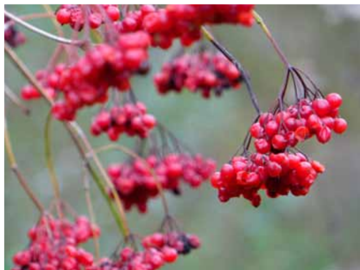
Bes Gelderse roos.

De bomen kleuren rood, geel en oranje, bladeren dwarrelen een voor een naar beneden, de vogels vliegen zuidwaarts en in de struiken glinsteren dauwdruppels op verse draden spinrag. Het is herfst! Op zondag 13 oktober organiseert IVN-West-Friesland om deze reden een exclusieve wandeling door een bijzonder natuurgebied nabij Andijk.