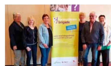
Kom helpen.

12.00 uur te doen samen met andere vrij- willigers? Meld je dan aan bij Vrijwilli- gersNH. Kijk voor informatie over de vacature op www.vrijwilligersnh.nl. Mailen of bellen kan naar info@vrijwilli- gersnh.nl of 0229-576416