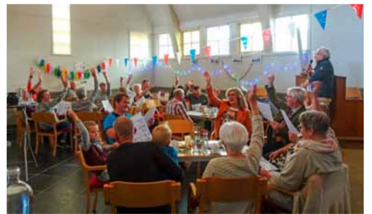
Geslaagde burendag in de Kapel. Foto's aangeleverd

De opkomst was groot in de prachtige locatie De Kapel. Er waren 70 buurtbewoners van de Middenweg aanwezig om de eerste burendag te beleven. We hebben een quiz gespeeld met vragen over Andijk en (specifiek) over de Middenweg. En een kennismaking via foto's van huizen, wie woont waar. En dit allemaal mogelijk gemaakt door 8 gedreven vrouwen, de medewerking van De Kapel en de donaties van de plaatselijke bakker en slager. Volgend jaar weer buurtjes.