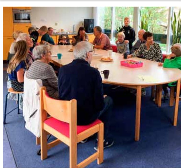
De burens mochten de school van binnen bekijken.

De plannen voor de herinrichting van het plein werden goed ontvangen! Een voetbalkooi op het plein is de grote wens van onze leerlingen. De burens vinden dit een prima plan.