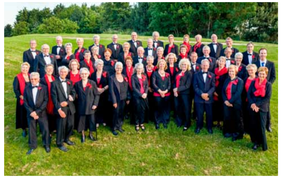
Westfrisia Cantat.

zondag 10 november om 15.00 uur in de Gerardus Majellakerk in Onderdijk.