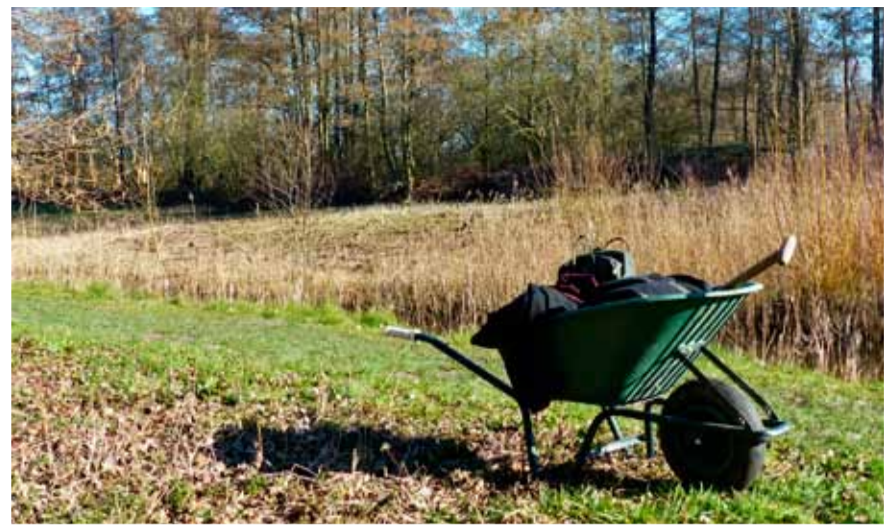
Kruiwagen Ecoproject.

Gezellig, gezond én goed voor de natuur, het kan! Samen de handen uit de mouwen steken, lekker bezig in de frisse buitenlucht, aan de slag om het voormalige eiland van 2 hectare in het Streekbos mooi, afwisselend en educatief toegankelijk te houden.