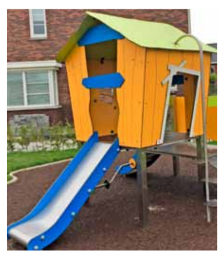
Het beoogde speelkasteeltje voor de peutertuin.