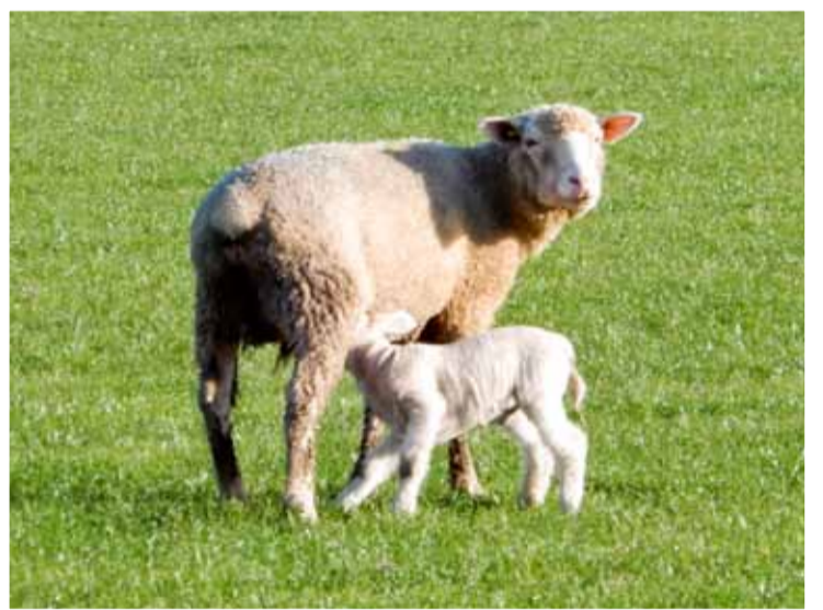
Langs de Gedeputeerde Laanweg fotografeerde Koos Dol al een moeder met lam.