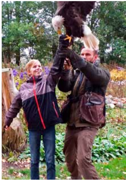
Geslaagde workshop!

In maart hadden wij (de moeder van Hidde en ik) een workshop gekocht bij Wings of Change en maandag 21 oktober was het zover.