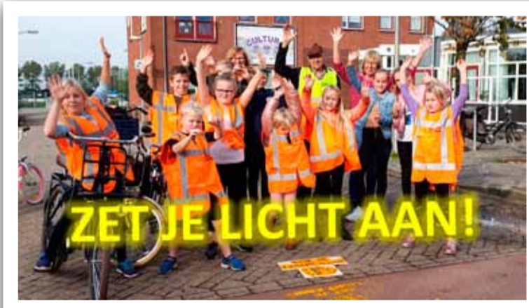
Deze ANWB actie werd op initiatief van de Dorpsraad in Andijk gehouden.

Kinderen hebben vorige week de actie-tekst: "ZET JE LICHT AAN!" met behulp van een sjabloon op de straat aangebracht op een paar plaatsen in Andijk.